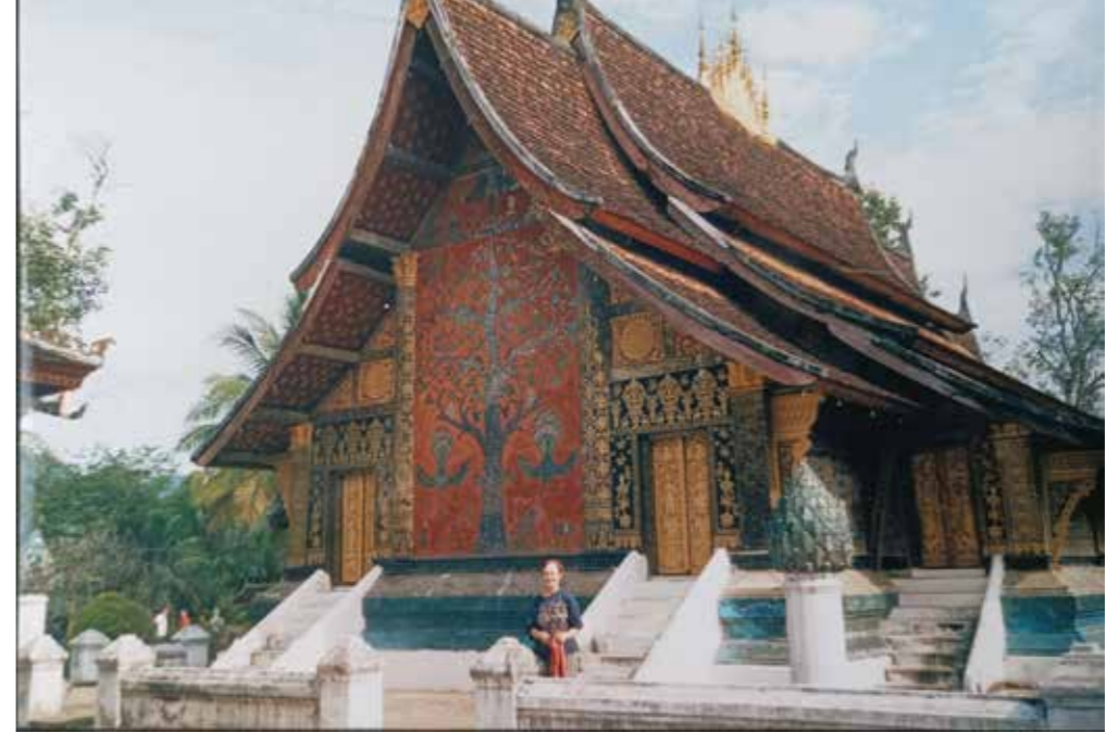
Laos, Luang Prabang, 1500-luvulta peräisin oleva buddhalainen temppeli Wat Sieng Thong.