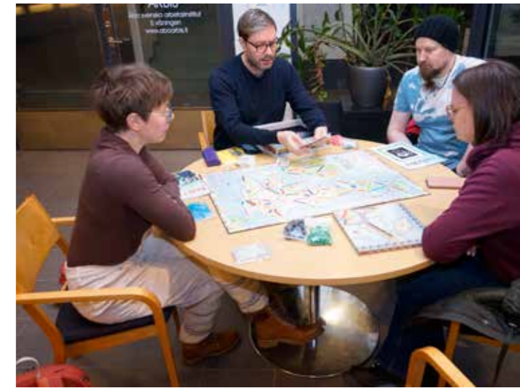
Pöytäseurueella pohdinnassa Menolipun englantilainen versio Ticket to Ride.