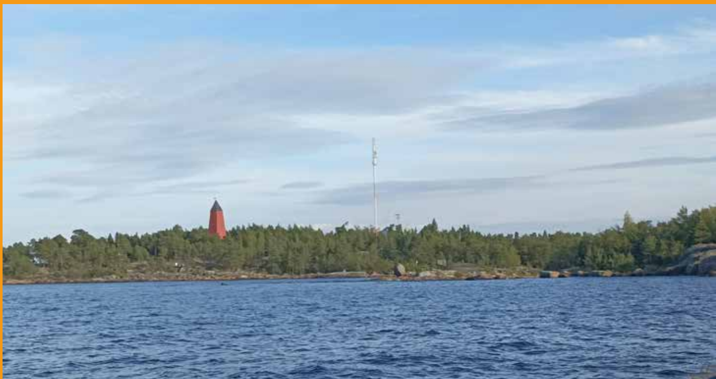
Mässkär. Juttu Kolme päivää ja kolme majakkaa sivulla 8.