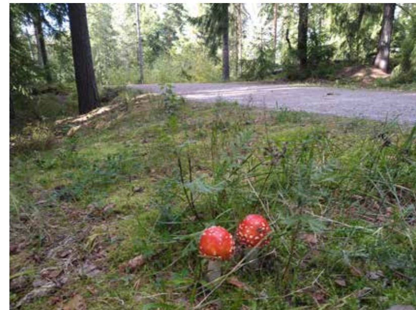
Syksyiset nuoret punakärpässienet Lausteella Turussa.