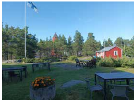
Mässkäriin pihapiiri, vasemmalle jää luotsiaseman sisäänkäynti, puiden lomassa siintää pooki.

Kun m/s Jenny toi meidät mantereelle, alkoi liki kolmen tunnin matka kohti Oulunsalon lauttarantaa. Tällekin matkaosuudelle Turun Taksiliikenteen Lau-