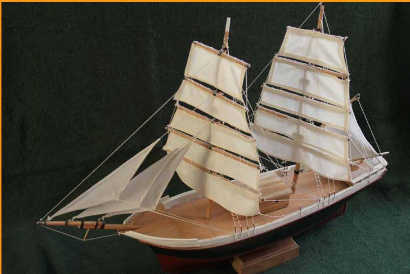
Kuvassa on yli 100-vuotias priki, jossa piti uusia kansivarustus sekä koko takila purjeineen. Tämä oli ensimmäinen rakentamani tai korjaamani pienoismalli. Lisää tarinoita pienoismalleistani on sivuilla 16 ja 17. Teksti ja kuva: Markku Luoto