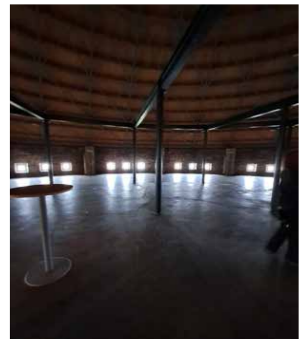
Ylimmän kerroksen pyöreässä tilassa oli hyvä akustiikka. Lattian alla on jopa 150 kuutiota kaukolämpövettä.