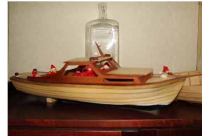
Veikko on valmis ja matkustajat kydyissä.