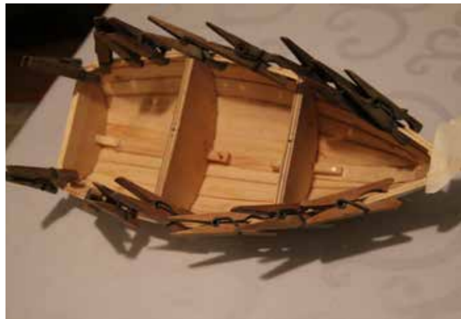
Muotokaaret ovat paikoillaan, kylkilaudoitus on valmis ja parraslistan liimaus on meneillään.