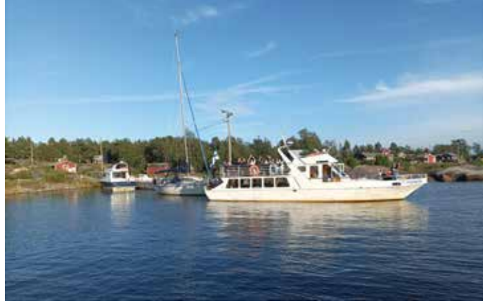
Mässkäriin viehättävä suojaista satama.