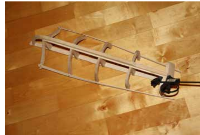
Köli on tehty, selkälauta kiinnitetty sekä muotokaaret tukirimoineen paikoillaan.