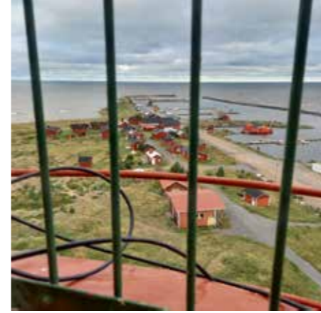
Marjaniemen majakkaan on 110 askelmaa, ja sinne pääsi 5 henkilöä kerrallaan. Puolipilvinen sää soi terävät näkymät kauas.