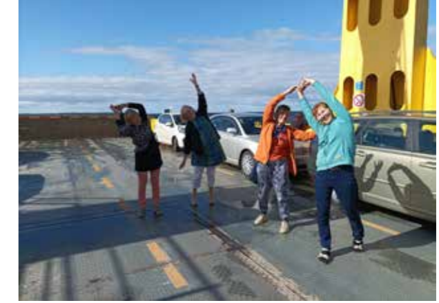
Hailuoto lautalla tanssijat.