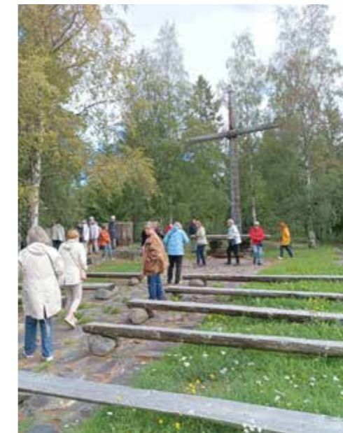
Hailuodon metsähautausmaalla, 1968 palaneen puukirkon raunioilla, sijaitsee ulkokirkko.