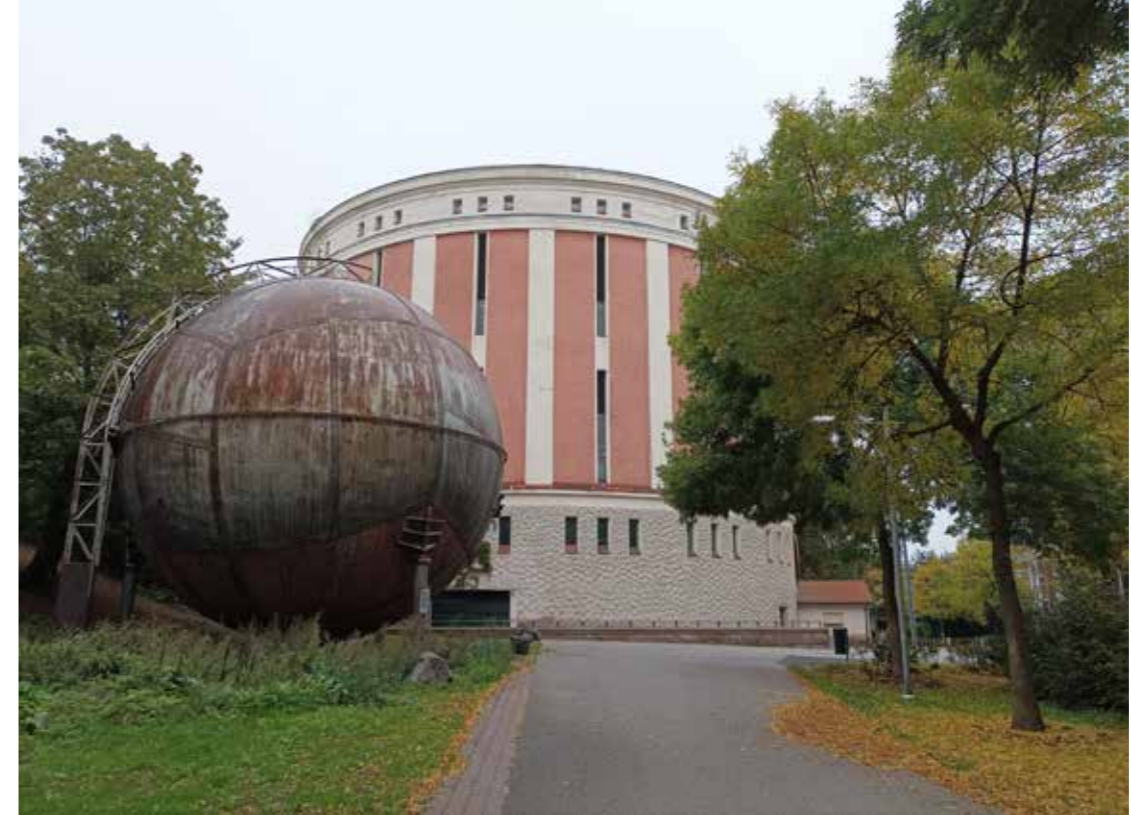
Kaasukellon vieressä on varasäiliö, jonka kapasiteettia tarvittiin kovilla pakkasilla.