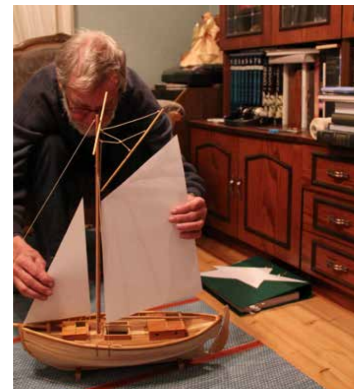
Pommern on valmis ja purjeita sovitetaan.