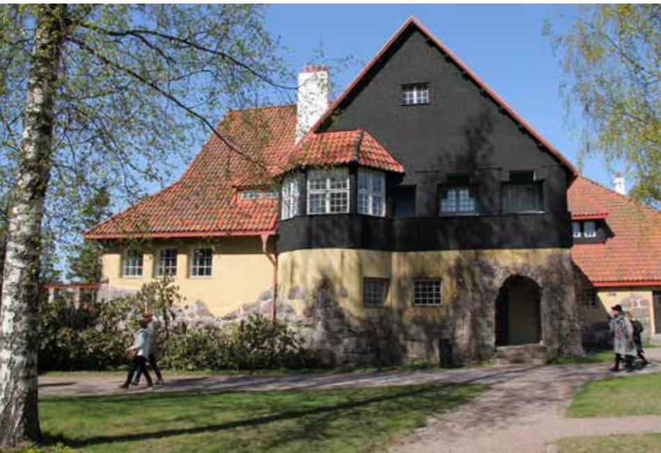
Hvitträskin päärakennus.