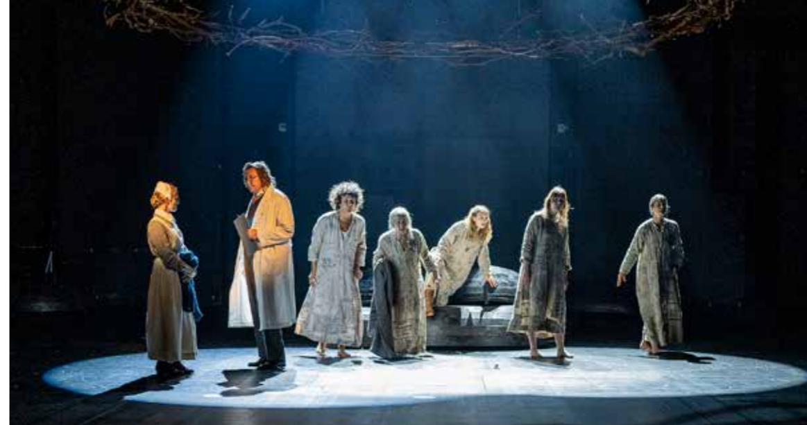
Själarnas ö, Svenska teatern. Kuvassa: