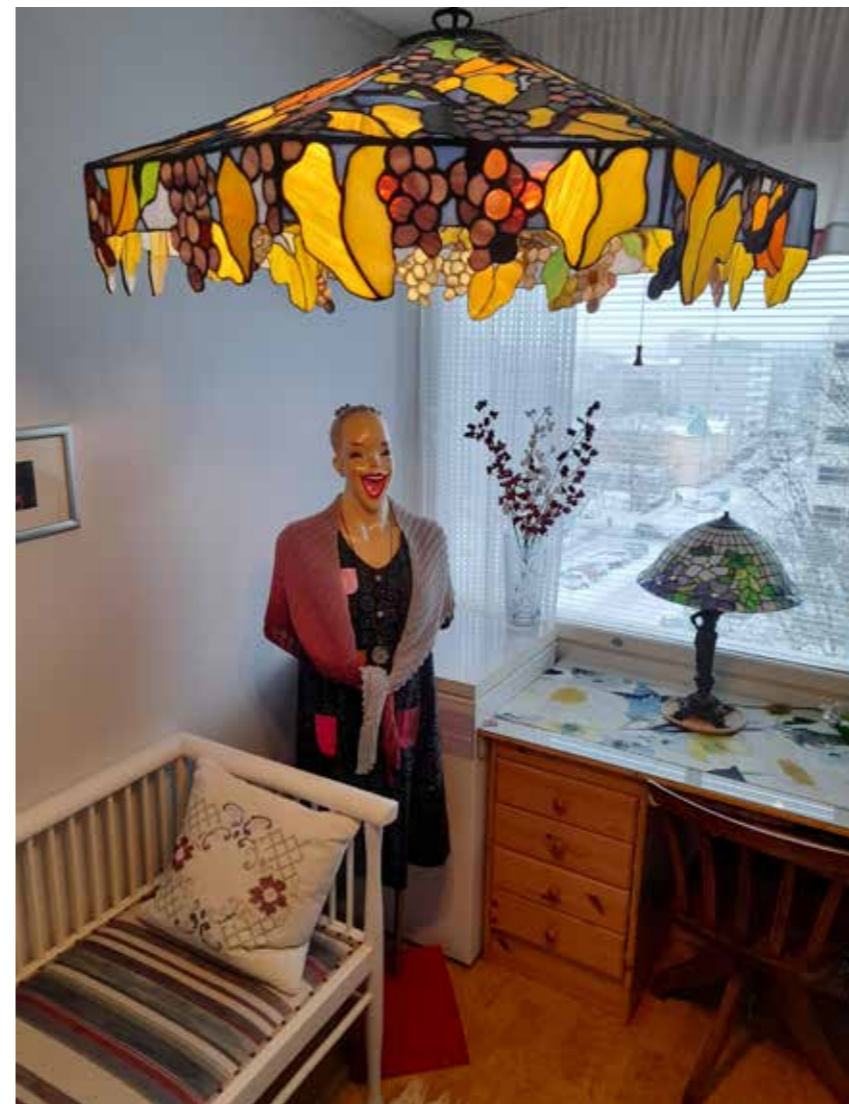
Mallinukke Doris ja valaisimista kaikkein suurin.

Marianne Klemelä teksti Reijo Nurmela kuvat