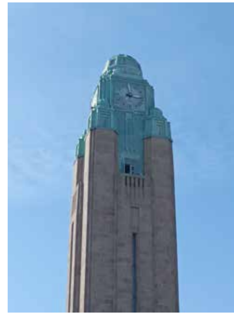
Tornikellon alapuolella on näköalaparveke.