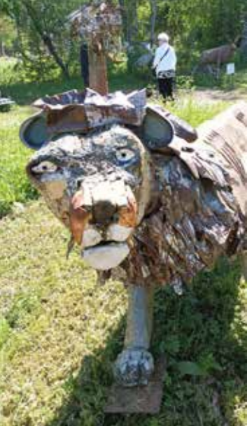
Alpo teki Suomen 100 vuoden itsenäisyyden kunniaksi kaksi leijonaa, joista tämä on toinen.