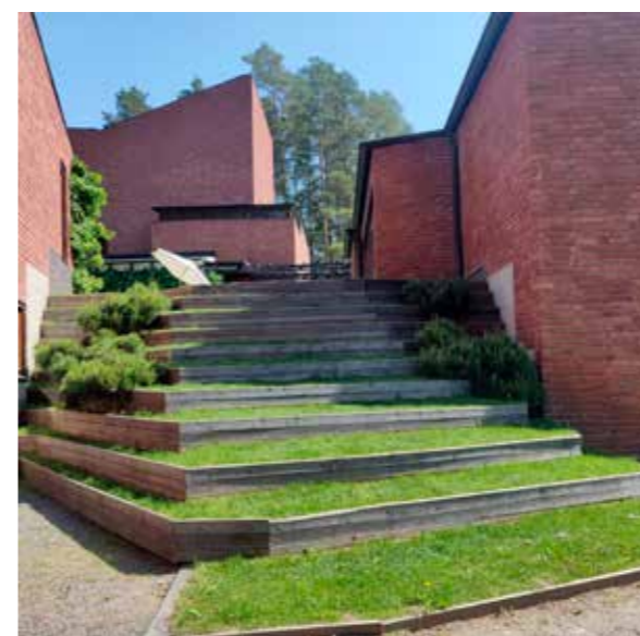
Säynätsalon kunnantalon keskellä on korotettu sisäpiha, jonne on nurmiportaat.

Säynätsalon valtuustosalin kattotuolit ovat Aallon mielestä kuin perhoset.