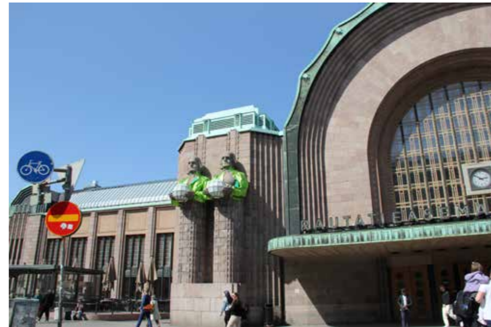
Tulevien Euroviisujen kunniaksi kivimiehet olivat saaneet päälleen Käärijän vihreät hihat.