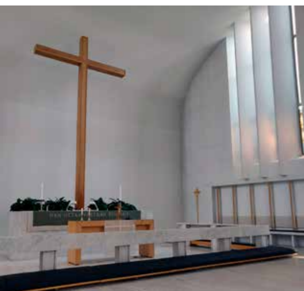
Lakeuden Ristin kirkko.

Matkalla Jyväskylään kävimme tervehtimässä pan-