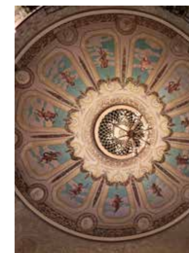
Mm. Moliere, Goethe, Ibsen, Strindberg, Runeberg, Topelius... reunustavat kattomaalauksen yhdeksää muusaa.