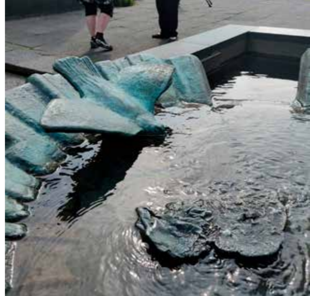
Alvar Aallon veistos, Seinäjoki.