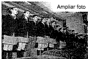
Celebración del Gordo de la Lotería de Navidad en el año 2010.