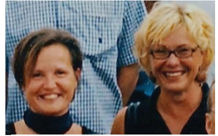
Dynaaminen duo since 2007 KIK&TUT (monistamon koulu- kuva-arkisto)

Vuoden aikana myös oppi kaikenlaista. Ehkä olennaisimpana asiana opin, että meidän tuntemamme opettajatkin ovat vain ihmisiä – ja vieläpä yllättävän samanlaisia kuin me lapsuuskaiset. Opekokouksissa koko henkilökunta muistutti yllättävän paljon aivan tavallista luokkaryhmää. Joku tykkää hoitaa samalla muita asioita koneella, toinen pelaa kännykkipeljä, kolmas nukkuu, neljäs keskittyy ja keskustelee. En kannusta kännyköiden käyttöön opetustilanteissa, mutta haluan muistuttaa ihmisten inhimillisyydestä. Meidän nuorkaisten kannattaa siis vaan olla omia itseämme, kyllä se kantaa. Me kaikki olemme erilaisia oppijoita ja jaamme erilaisia kiinnostuksen kohteita. Olkaa siis armollisia itsellenne, kukaan ei ole täydellinen.