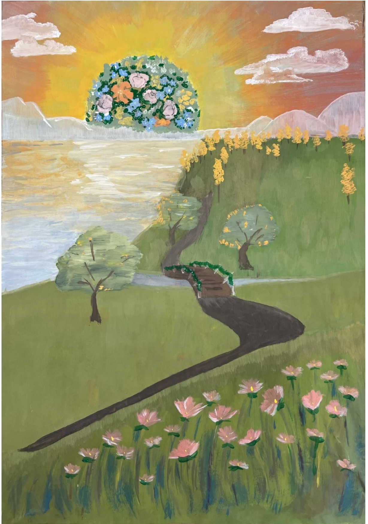
Flow of flowers, Eino Oravakankaan peitevärimaalaus