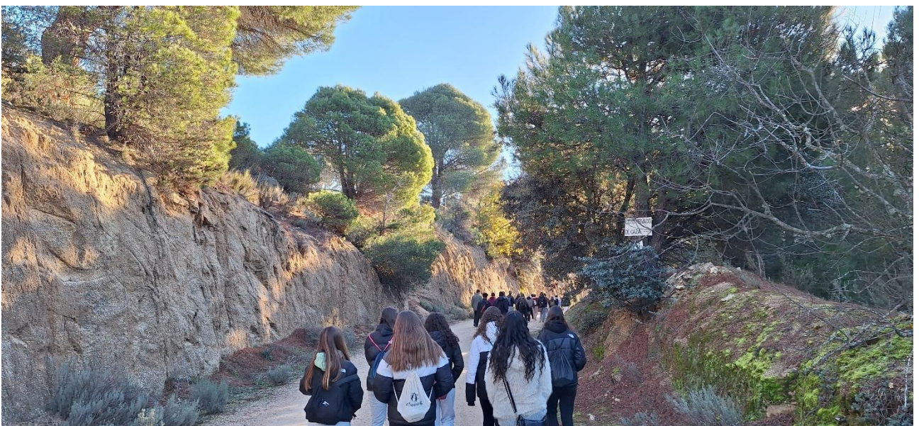
Patikointia Espanjassa aurinkoisena joulukuun päivänä