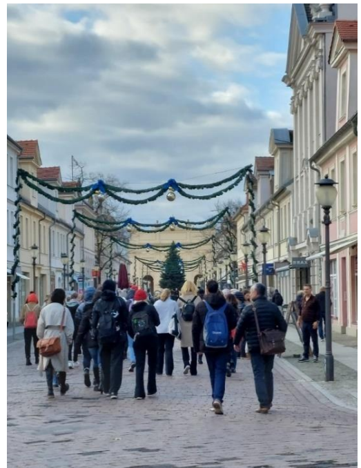
Opiskelijat kaupunkikävelyllä Potsdamissa