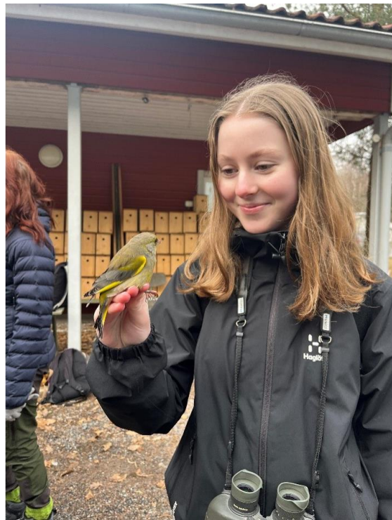
Sonja ja viherpeippo

Puutarhalla pääsimme myös tutustumaan lintujen rengastukseen. Siellä kädessä nähtyjä lajeja tuli ihan mukava määrä. Hieno päivä, kiitos osallistujille.