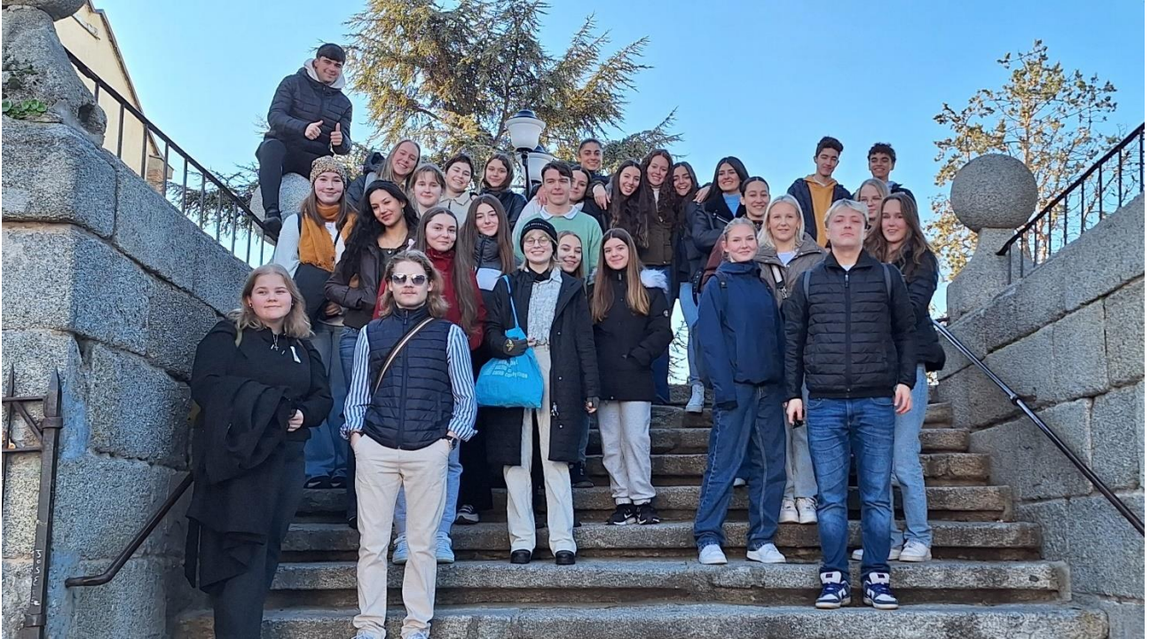
Yhteiskuva espanjalaisten ystäviemme kanssa