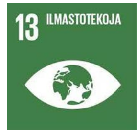
Agenda 2030 tavoitteita